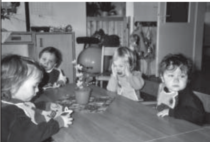
Die Erzieherinnen der Kindertagesstätte