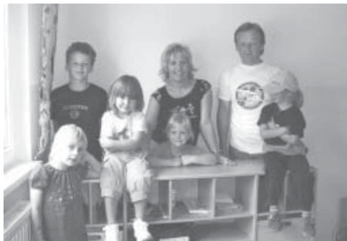
Das Mitarbeiterteam der AWO-KITA „Bunte Spielwelt“ Kamsdorf

Diesen beiden Unternehmen nochmals im Namen aller Kinder ein ganz herzliches Dankeschön.