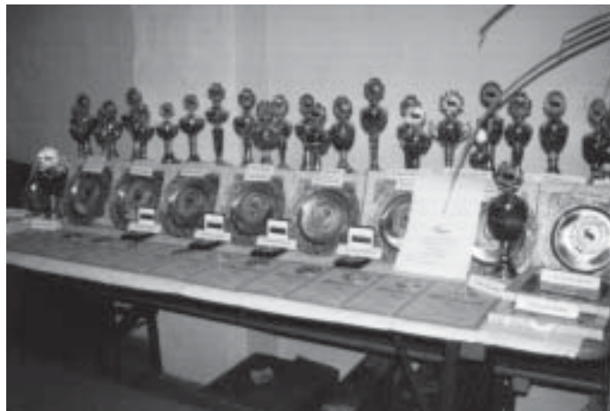
Ehrenpreise, -pokale, Kreismeister und Siegerurkunden für die besten Aussteller

Unser Kaninchenzuchtverein möchte sich auf diesem Wege nochmals bei allen Freunden und Förderern, die diese Ausstellung durch Spenden, Preisstiftungen und andere Zuwendungen unterstützt haben, bedanken. Ein ganz besonderer Dank gilt der Agrargenossenschaft e.G. Zollhaus, die uns ihre mit großem Aufwand neu gestaltete Halle zur Verfügung gestellt hat. Nur dadurch war es möglich, eine solche Resonanz bei den Besuchern aus nah und fern zu erreichen.