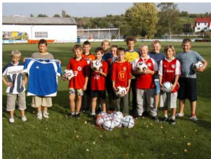
D-Junoren der Spielgemeinschaft

Die in den Monaten Juni/Juli durchgeführte Werbeaktion für Zeitungsabonnenten war für die Nachwuchsfußballer des TSV Zollhaus sehr erfolgreich. So konnten durch die Sportwerbefirma vor kurzem 20 Adidas-Spielbälle und ein Satz Adidas-Trikots übergeben werden. Der TSV Zollhaus bedankt sich bei allen, die dazu beigetragen haben.