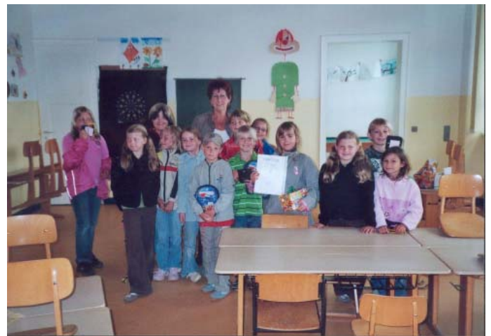
Die Lesewürmchensammelkinder der Grundschule

Die kleinen Leserinnen und Leser hatten über das letzte Schuljahr hinweg bei jeder Buchausleihe ein Lesewürmchen bekommen, welches auf den Lesewürmchensammler geklebt wurde. Belohnt wurden die fleißigen Kids am letzten Tag des Schuljahres mit einem kleinen oder größeren Geschenk.