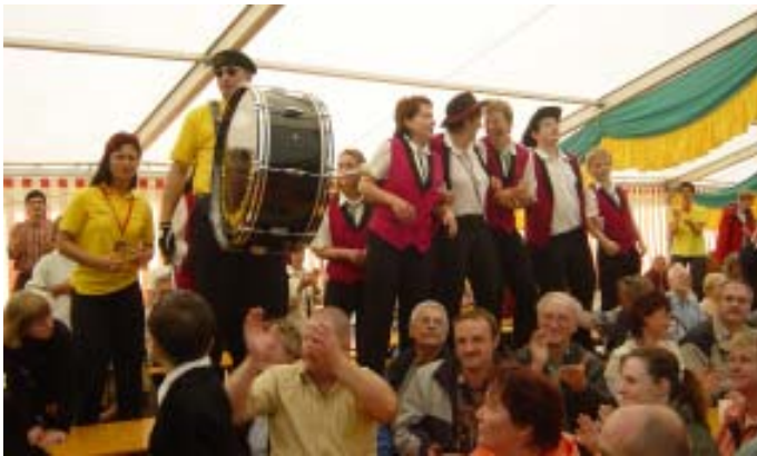
Schalmeienkapellen aus Milkau und Kleinreinsdorf