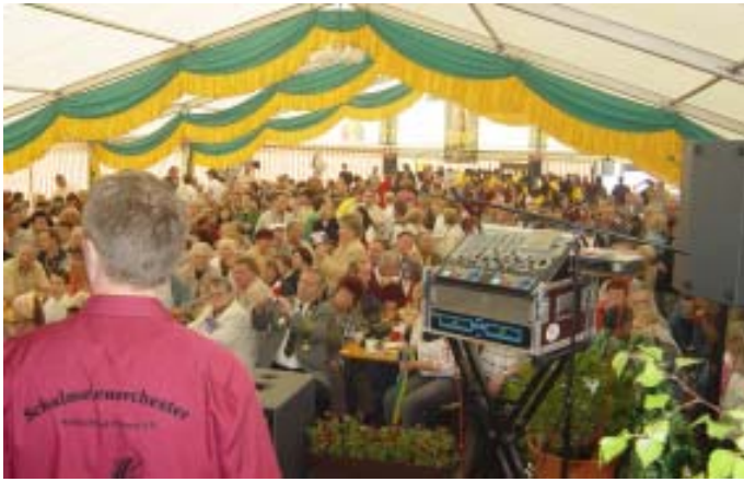
Ein volles Festzelt