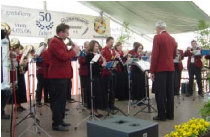
Blaskapelle Leuchsenthaler Blasmusik Mistelfels