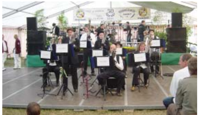
Da Capo Schalmeienmusik aus Berlin