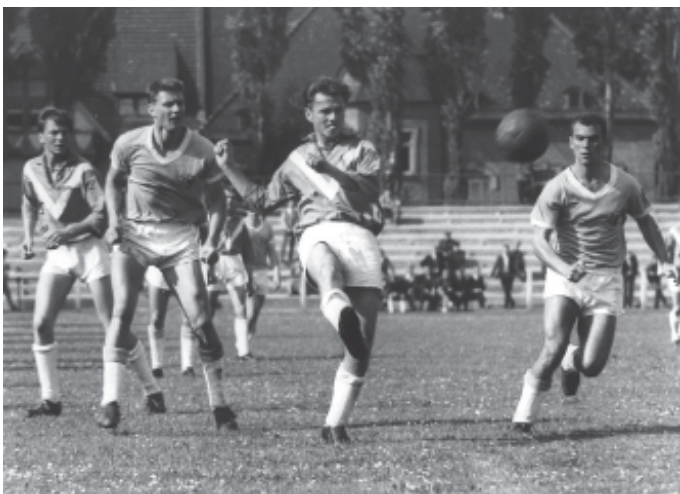
Spiel Stahl Maxhütte Unterwellenborn – Karl-Marx-Stadt 2:4